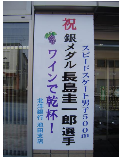
北洋銀行お祝いのパネル