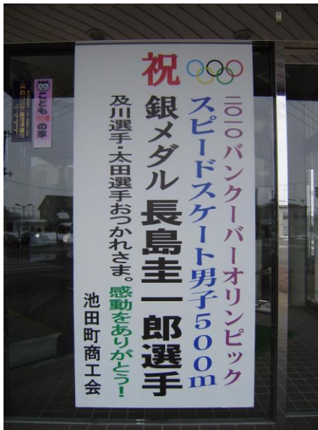
商工会正面にもお祝いのパネル