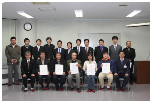
入賞者の皆さんと記念撮影