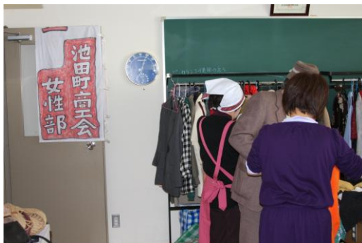
フリーマーケットの様子

2 月 21 日(日)、池田町田園ホールで「池田町女性フェスティバル」が開催されました。 商工会女性部では、フリーマーケットコーナー、飲食コーナーに参加をしました。