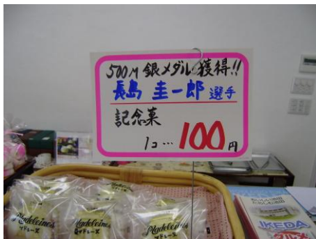
「お菓子のかほり」さん記念菓発売