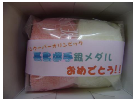
「お菓子の小松」さん記念菓発売