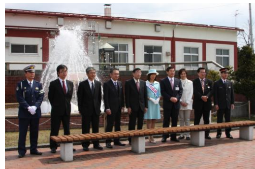
噴水をバックに記念撮影