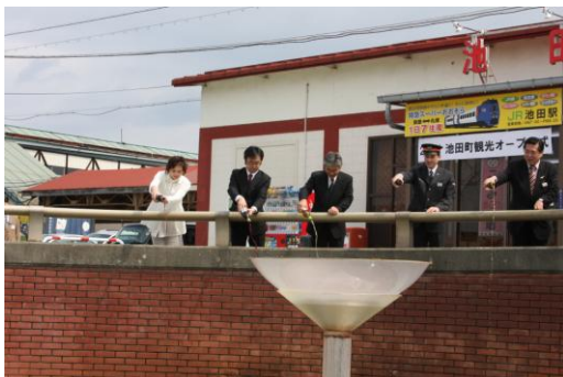
噴水にワインを注いで・・・