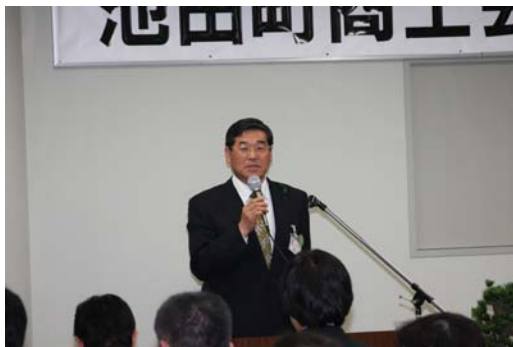
勝井町長の来賓挨拶