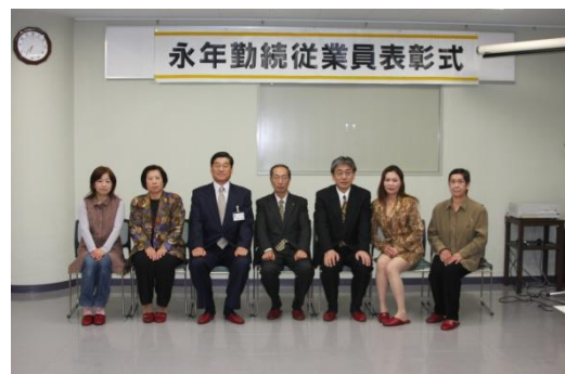
十勝製餡の皆さん