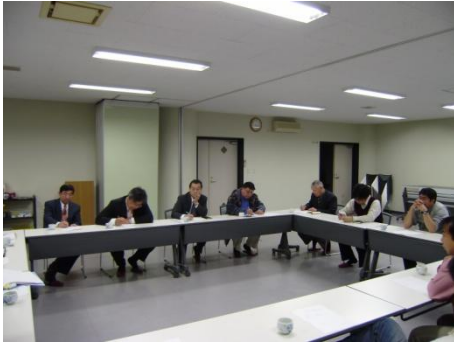
町議会議員との懇談会