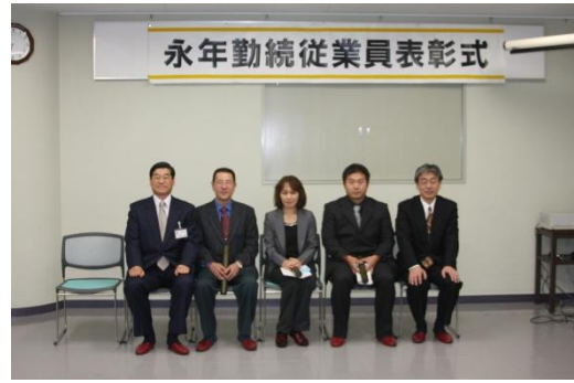
田岡燃料の皆さん