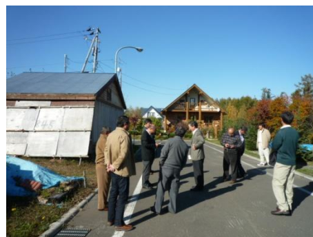
由仁町での現地説明