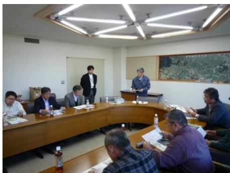
栗山町役場での説明

南幌町では移住体験住宅を視察し、懇談会では視察先の取り組みや池田町の今後の事業活動について、熱心に協議が行われました。