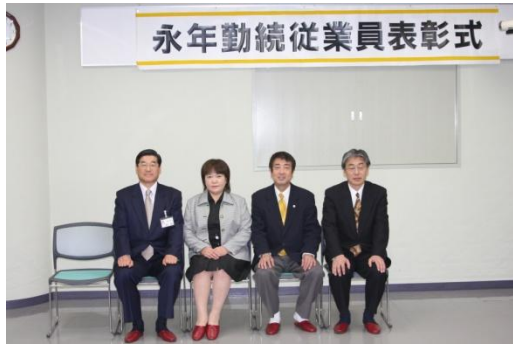
大熊歯科医院さん