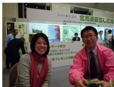
東京会場での相談