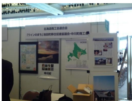
池田町ブース(東京会場)

池田町ブースでも今後の移住に向けた真剣な話し合いが行われ、今後の可能性に希望を見出す有意義な参加となりました。